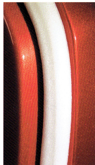
使用後のノリ残りを最小限に

型式 V-13 (径13mm 50m ロール 5m×10本) V-19 (径19mm 35m ロール 5m×7本) BOXサイズ: 幅17.0×高さ33.0×奥行33.0cm