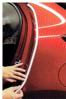
高密度スポンジ採用